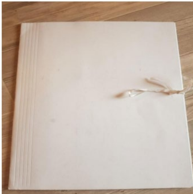
Rys. 1. Zdjęcie przedstawia teczkę wiążaną bezkwasową do archiwizacji dokumentów bez nadruku (strona zewnętrzna)