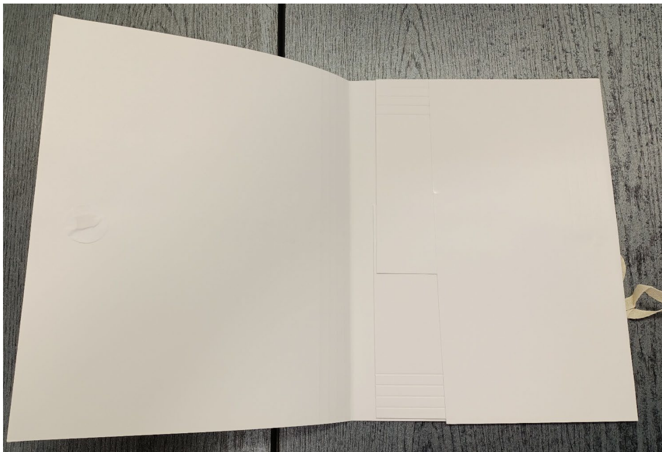
Rys. 2. Zdjęcie przedstawia teczkę wiążaną bezkwasową na akta osobowe studenta (strona wewnętrzna)