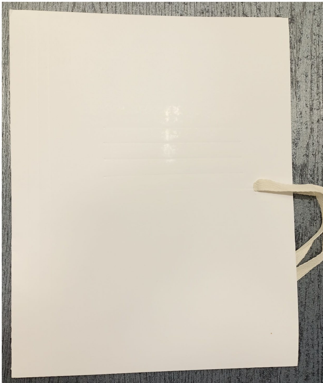
Rys. 1. Zdjęcie przedstawia teczkę wiążaną bezkwasową do archiwizacji dokumentów bez nadruku (strona zewnętrzna)