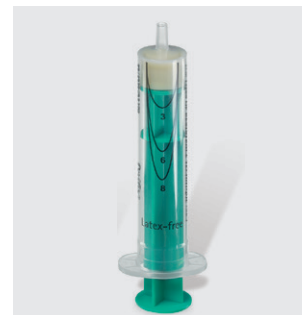
Perifix® strzykawka do metody spadku oporu (LOR)