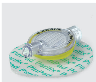
Perifix® filtr płaski z systemem mocowania Perifix PinPad